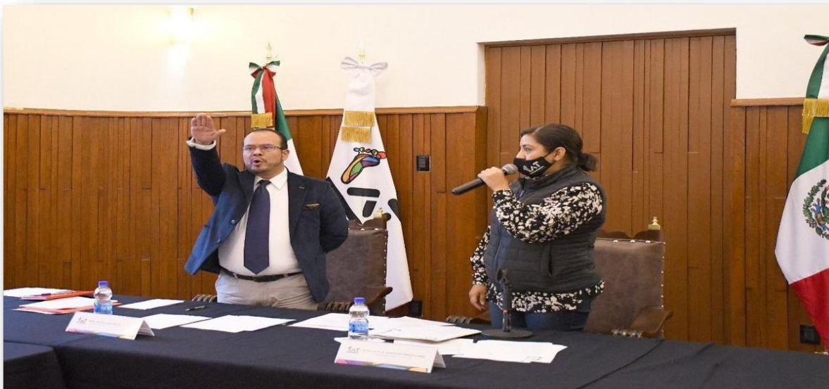
Imagen 2.- Primera Sesión Ordinaria, Toma de Protesta del Secretario Técnico del Concejo. Foto tomada el 29 de octubre del 2021.

De conformidad con el artículo 94 de la Ley Orgánica de Alcaldías de la Ciudad de México, el Segundo Concejo contó con una Secretaría Técnica que, en su calidad de órgano técnico-operativo, fue la encargada de auxiliar en el desarrollo de las Sesiones y de dar seguimiento al cumplimiento de los acuerdos y coadyuvar en el funcionamiento de este Segundo Concejo de la Alcaldía Tlalpan. Estuvo encabezada por un Secretario Técnico, el cual fue propuesto por la Titular de la Alcaldía y ratificado por el Pleno del Concejo.