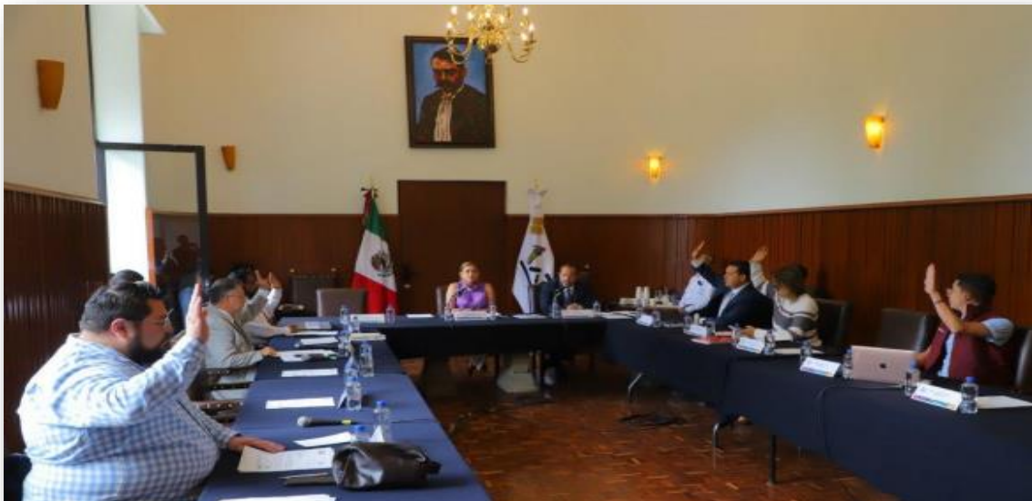
Imagen 5. - Décima Séptima Sesión Ordinaria del Concejo. Foto tomada el 10 de abril del 2023.