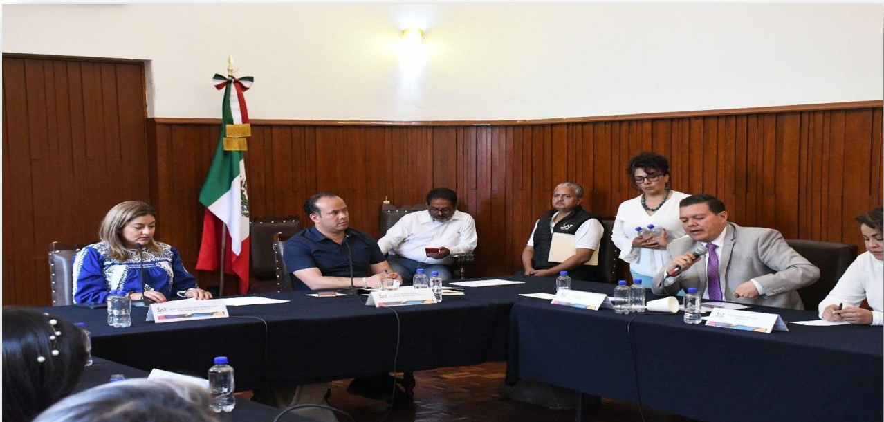
Imagen 8. – Vigésima Primer Sesión Ordinaria del Concejo.