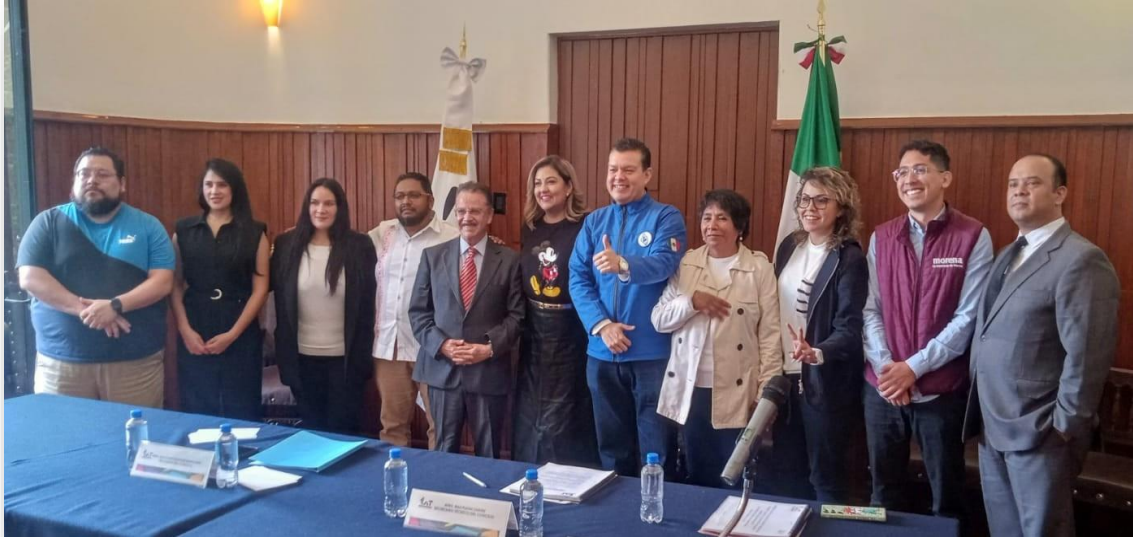
Imagen 1.- Vigésima Quinta Sesión Ordinaria. Integrantes del Concejo. Foto tomada el 08 de agosto del 2024.

Este Concejo se formó con 10 integrantes (5 Concejales y 5 Concejales), y fue Presidido por la Alcaldesa; se sujetó, en todo momento, a los principios de transparencia, rendición de cuentas, accesibilidad, difusión y participación ciudadana.