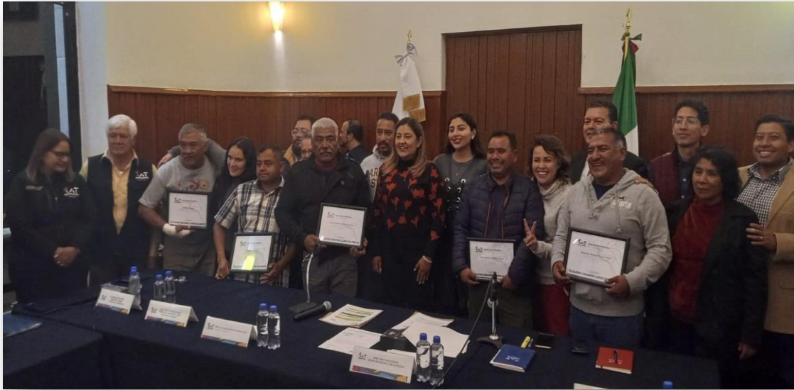
Imagen 4. – Tercera Sesión Solemne del Concejo. Foto tomada el 13 de noviembre del 2023.