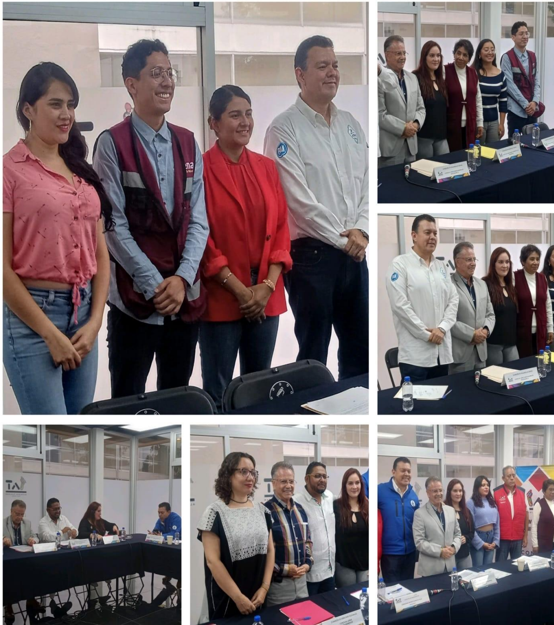
Imagen 10. Sesiones de las Comisiones del Concejo.