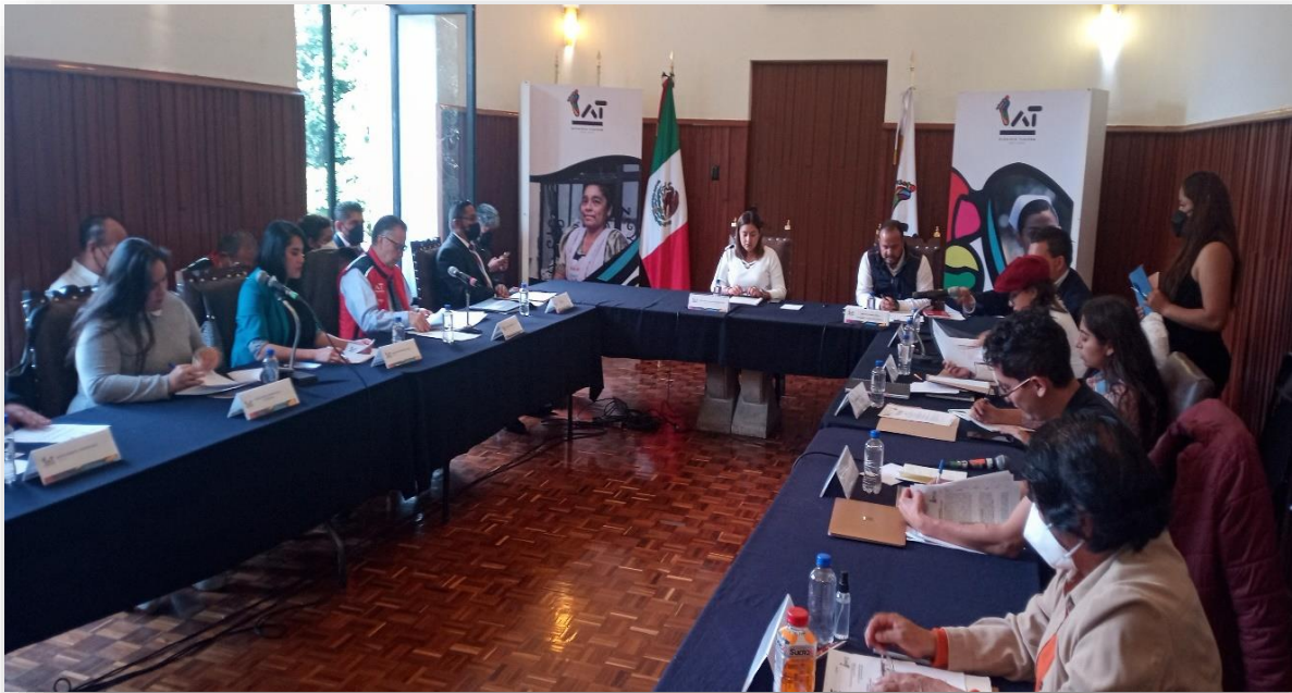
Imagen 3.- Segunda Sesión Ordinaria del Concejo. Foto tomada el 12 de noviembre de 2021.

En el periodo comprendido del 1° de octubre del 2021 al 30 de septiembre del 2024 se realizaron: 4 Sesión Solemnes, 6 extraordinarias y 25 Ordinarias , llevándose a cabo un total de 35 sesiones.