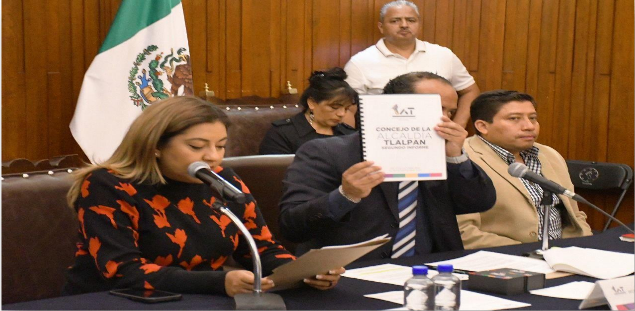
Imagen 7. – Tercera Sesión Solemne del Concejo. Foto tomada el 13 de noviembre del 2023.