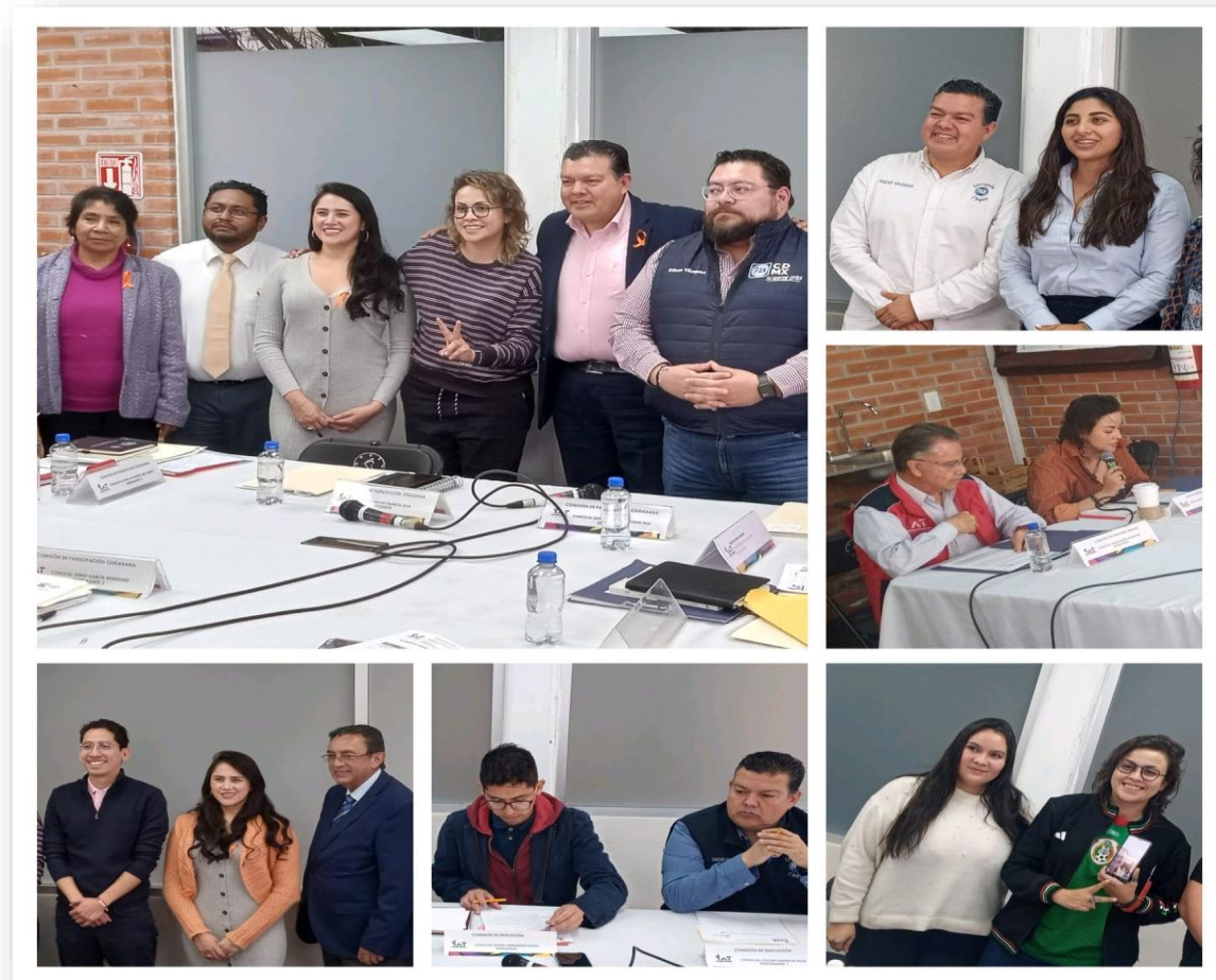
Imagen 9. Sesiones de las Comisiones.