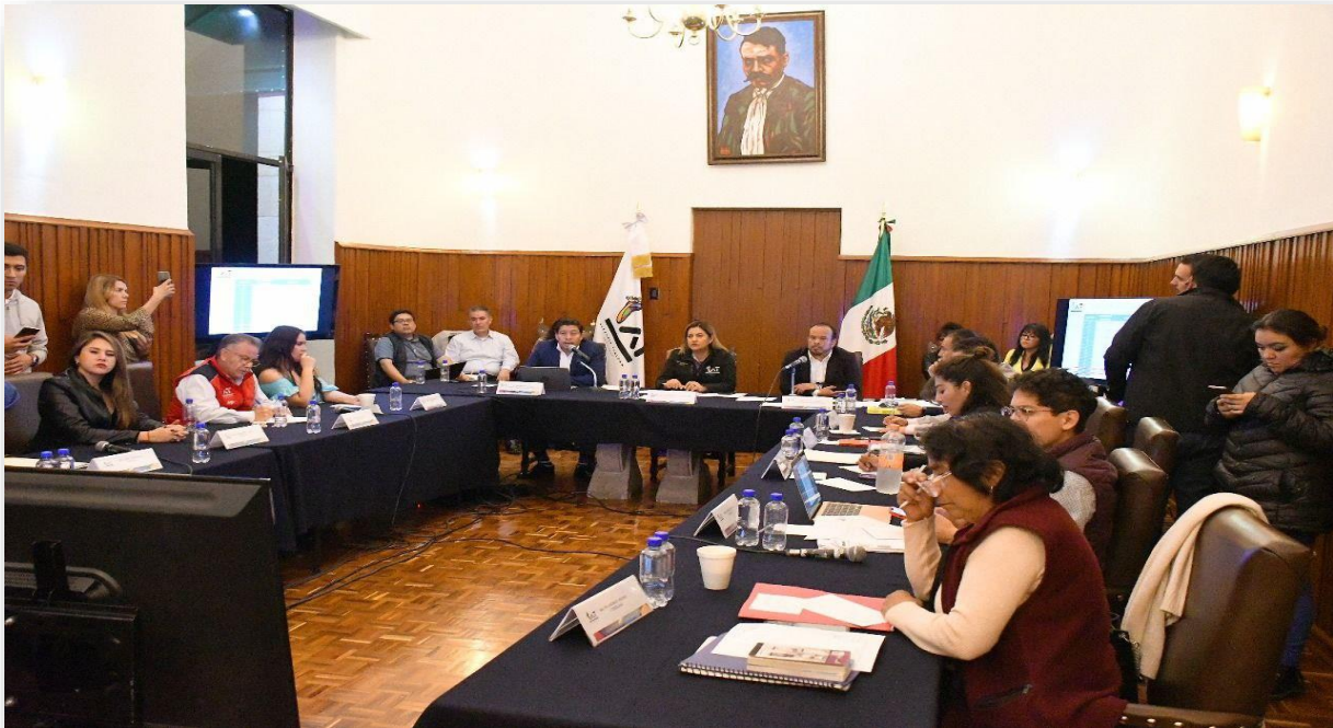
Imagen 6. – Quinta Sesión Extraordinaria del Concejo.