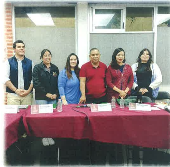
COMISION DE MEDIO AMBIENTE