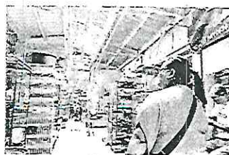
De acuerdo con el análisis, no hay asociaciones que velen por el bienestar de las especies en el establecimiento.

En el Mercado Sonora también se ofrecen especies