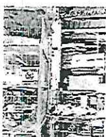
Las jaulas de animales son encerradas, poniéndolos en riesgo.

marinas como tortugas y peces, pero principalmente perros, palomas, gallinas, patos y conejos.