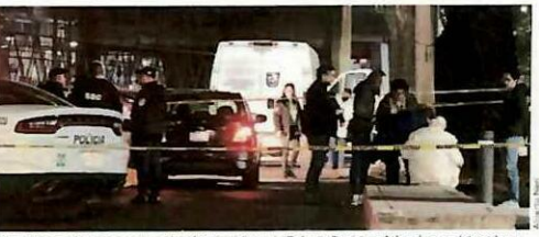
El martes por la noche se registró el homicidio en la Colonia Purísima Atlapalpa, en Iztapalapa.

Con fundamento en los artículos 107 de la Ley de Mecánica para la Ciudad de México y 472 del Código de Procedimiento Civil para el Estado de México, se hace saber que por haber concluido el ciclo de 12 meses de vigencia de la PRIMERA PULCRIFICACION de los vehículos que se encuentran en la categoría de AUTO BOTANAL, se les otorga el primer mantenimiento de la categoría de AUTO BOTANAL y se les otorga el primer mantenimiento de la categoría de AUTO BOTANAL y se les otorga el primer mantenimiento de la categoría de AUTO BOTANAL. Los lugares de atención son: CENTRO DE SERVICIOS AL CLIENTE (CSC) de la Alcaldía de Iztapalapa, en la colonia Purísima Atlapalpa, en Iztapalapa, y en las oficinas de la Alcaldía de Iztapalapa, en la colonia Purísima Atlapalpa, en Iztapalapa. El día: JUEVES 14 DE DICIEMBRE DEL 2022. El lugar: OFICINA DE ATENCIÓN AL CLIENTE (OAC) de la Alcaldía de Iztapalapa, en la colonia Purísima Atlapalpa, en Iztapalapa.