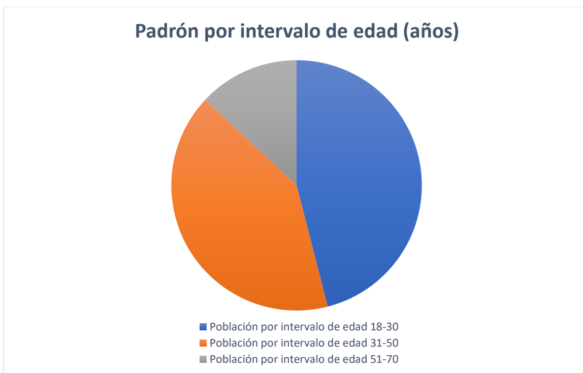
Gráfica 2. Padrón de beneficiarios por intervalos de edad del programa Imagen Urbana para Cultivar Comunidad, de la Dirección General de Servicios Urbanos (DGSU) expresado en porcentaje, Alcaldía Tlalpan 2021 OCTUBRE – DICIEMBRE