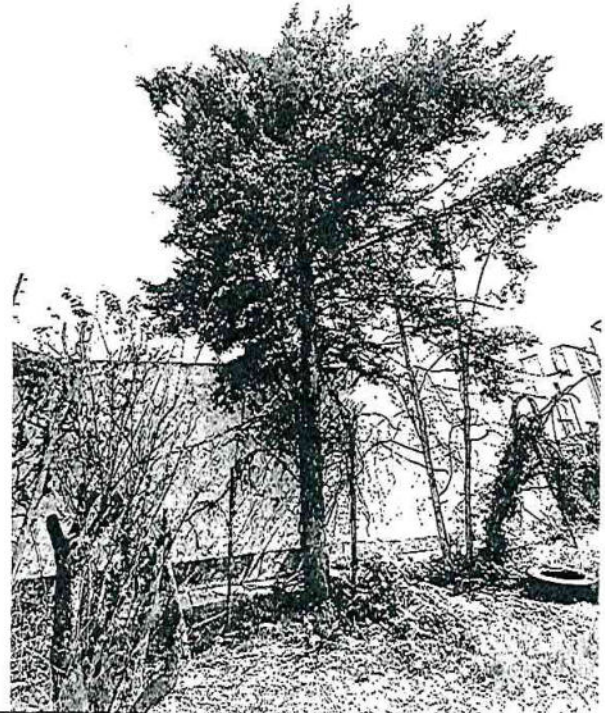
Arbol 1 Cedro blanco ( Hesperocyparis lusitanica )