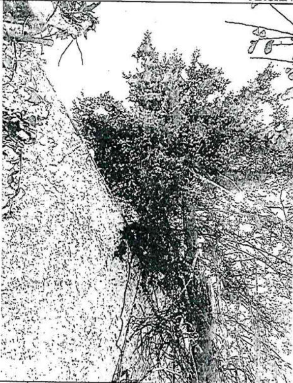
Arbol 1 Cedro blanco ( Hesperocyparis lusitanica )